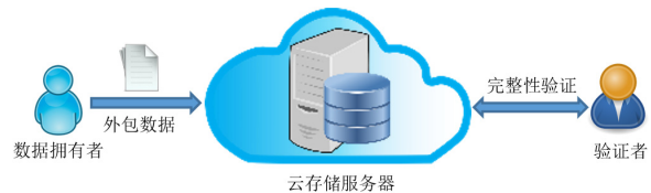
图1 云存储完整性验证系统模型

即数据拥有者、云存储服务器和验证者, 其系统模型如图1所示。云存储服务器是非可信的实体, 具有强大的存储能力, 在向用户提供数据存储服务的同时也将完全控制用户的外包数据。存储在云端的远程数据可能遭受不经意的丢失(如由于硬件故障)或遭受恶意篡改(如云服务器为了节省存储资源而删除部分不经常访问的用户数据)。数据拥有者和验证者都是云用户, 前者处理数据、生成元数据并上传至云端, 不要求在本地图保存数据副本, 后者负责验证外包数据的完整性。该系统也要求云存储服务器具有强大的计算能力, 即在完整性验证阶段, 针对验证者发送来的查询挑战, 云服务器应能快速生成一个响应。