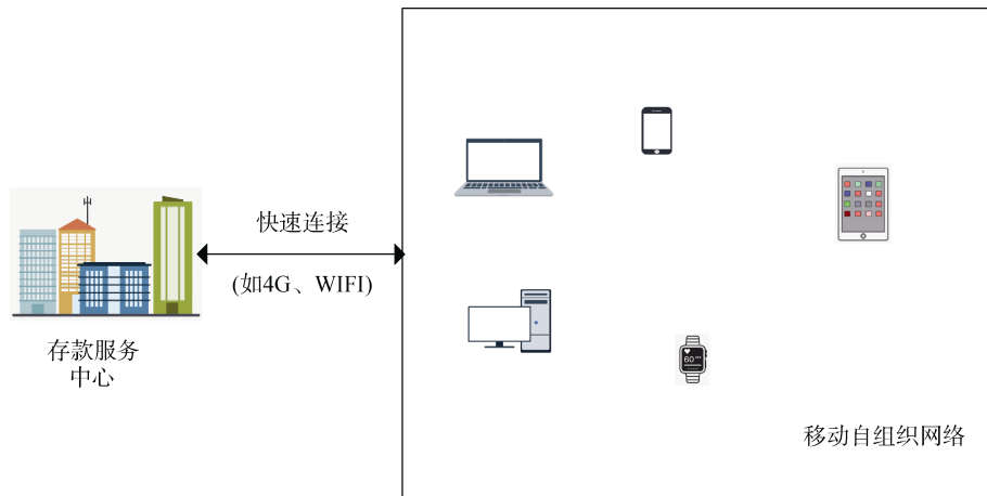
图 1 系统框架